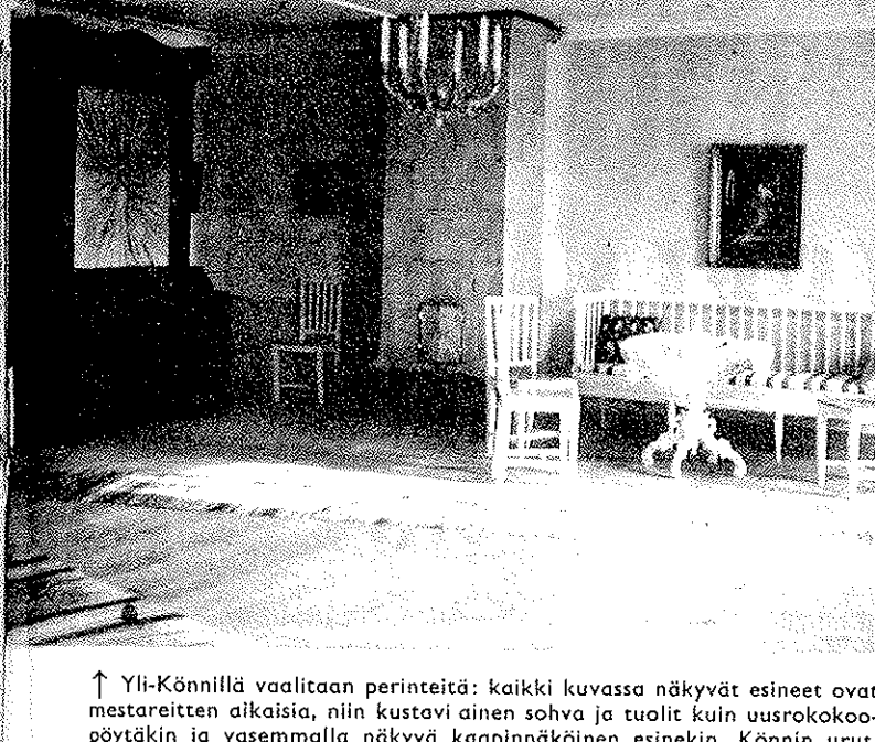
↑ Yli-Könnillä vaalitaan perinteitä: kaikki kuvassa näkyvät esineet ovat mestareitten aikaisia, niin kustavi ainen sohva ja tuolit kuin uusrokokoopöytäkin ja vasemmalla näkyvä kaapinnäköinen esinekin, Könnin urut, joita on lainattu Ilmajoen kirkkoonkin. Seinät olleet alunperin kellertävät, ruskealla pilkutetut.